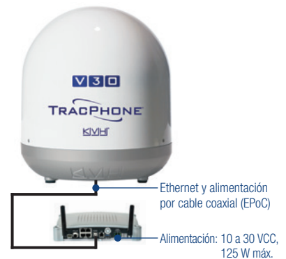
Antena TracPhone V30 y VSAT-Hub