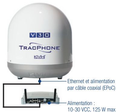
Antenne TracPhone V30 et VSAT-Hub