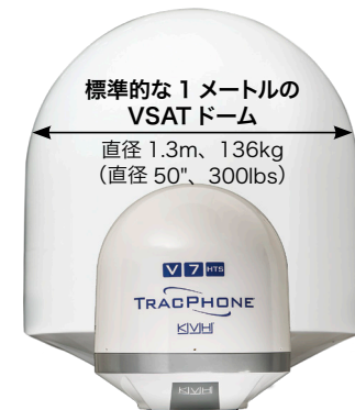
標準的な 1 メートルの VSAT ドーム 直径 1.3m、136kg (直径 50"、300lbs)

スリムな船内ユニットに、IP 対応アンテナコントロールユニット、内蔵 CommBox 船陸間ネットワークマネージャ、高速モデム、VoIP アダプタ、組み込み型の Wi-Fi とイーサネットスイッチを搭載。